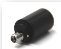
ヘリカルアンテナ (28GHz)