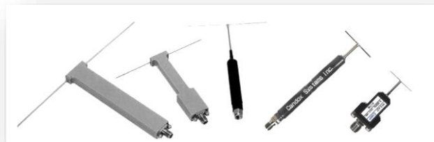
ダイポールアンテナ(200MHz~12GHz)