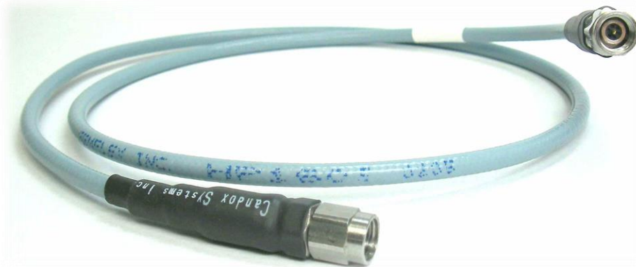
測定用 同軸ケーブル(1,000mm) 5B-048-98-98-1000